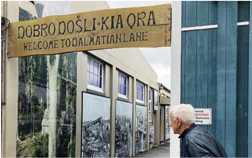
Slika 3. Dalmatian lane u mjestu Kaitaia u Novome Zelandu

Zelandu. Uz stup je i ploča na kojoj je naslov na engleskom i dvojezični podnaslov (Croatian: Our Heritage – Naša povijest). Slijedi tekst u 30-ak redaka na engleskom koji opisuje stup dajući pregled povijesti dolazaka Hrvata u Novi Zeland i njihovu povezanost s Maorima.