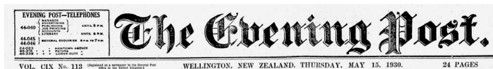
Slika 5. Zaglavlje broja 113 iz 1930. godine novina The Evening Post u kojima je objavljen tekst o T. Pavlović

https://paperspast.natlib.govt.nz/newspapers/EP19300515.2.119 .