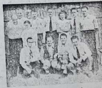
Clanovi glazbenog ogranka.

Jaki ljudi ostaju u svojim načelnima čvrsti, i ako ih sudbina dovede u teško položaje. Njihova nutrina ne mjenja se. Niti u sreći, niti u nesreći. Karakter ostaje čvrst, a i Duh ne labavi. Kod takovih ljudi i sudbina ostaje ne moćna.