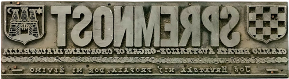
Slika 4. Tiskarski kliše za novine Spremnost (Hrvatski arhiv Australije, Sydney)

Kao u Novom Zelandu, i u Australiji postoje brojni privatni arhivi, privatne zbirke i arhivi zajednica koji potencijalno čuvaju do sada neistražene publikacije i/ili dokumente. Primjerice, u Sydneyu djeluje Hrvatski arhiv Australije u kojem se čuvaju rukopisi, publikacije i dokumenti – oko 400 knjiga, serijske publikacije (među kojima su svi brojevi novina Spremnost ) i oko 200 dokumenata povezanih s djelovanjem Hrvata u Australiji (primjerice dokumenti povezani s osnivanjem hrvatskih društava). Osim toga, čuvaju se i poneki predmeti kao što je tiskarski kliše za novine Spremnost , koje su izlazile u Sydneyu od 1957. do 2007. godine (Slika 4).