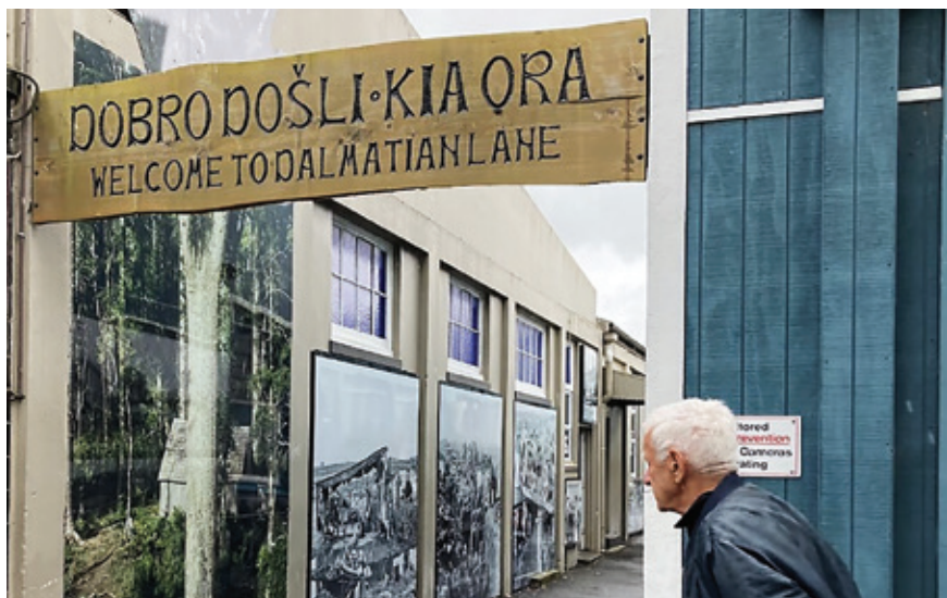
Slika 3. Dalmatian lane u mjestu Kaitaia u Novome Zelandu

Zelandu. Uz stup je i ploča na kojoj je naslov na engleskom i dvojezični podnaslov (Croatian: Our Heritage – Naša povijest). Slijedi tekst u 30-ak redaka na engleskom koji opisuje stup dajući pregled povijesti dolazaka Hrvata u Novi Zeland i njihovu povezanost s Maorima.