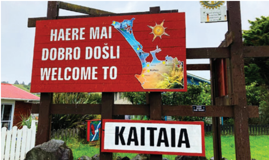
Slika 2. Natpis na ulazu u mjesto Kaitaia